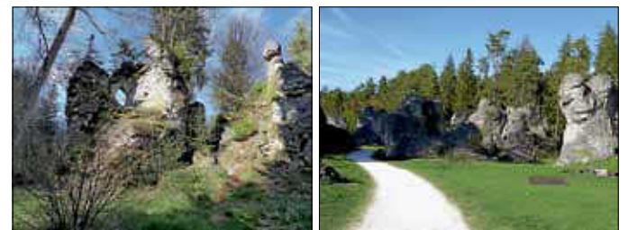
Beeindruckende Felsenadeln im Wental ... und Felsenmeer

Gnannental – Wental – Felsenmeer – Eine Wanderung auf der Ostalb mit viel Natur, Sagen und Geschichten