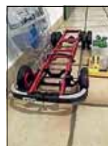
Lkw im Bau

Clubabend ab 18 Uhr in der Pfarrstr. 18. Wer mag, kann einfach mal reinschauen. Jeden Freitag in Rutesheim. Wir basteln zusammen an den Projekten.