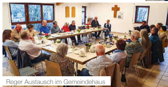
Regel Austausch im Gemeindehaus

Die Veranstaltung dient dem Kennenlernen, Austausch und der Kontaktpflege zwischen den Gemeinden. Nach der Begrüßung im Gemeindehaus erhielten die Gäste zunächst eine Führung durch den Waldenserort Perouse. Bei Kaffee, Kuchen