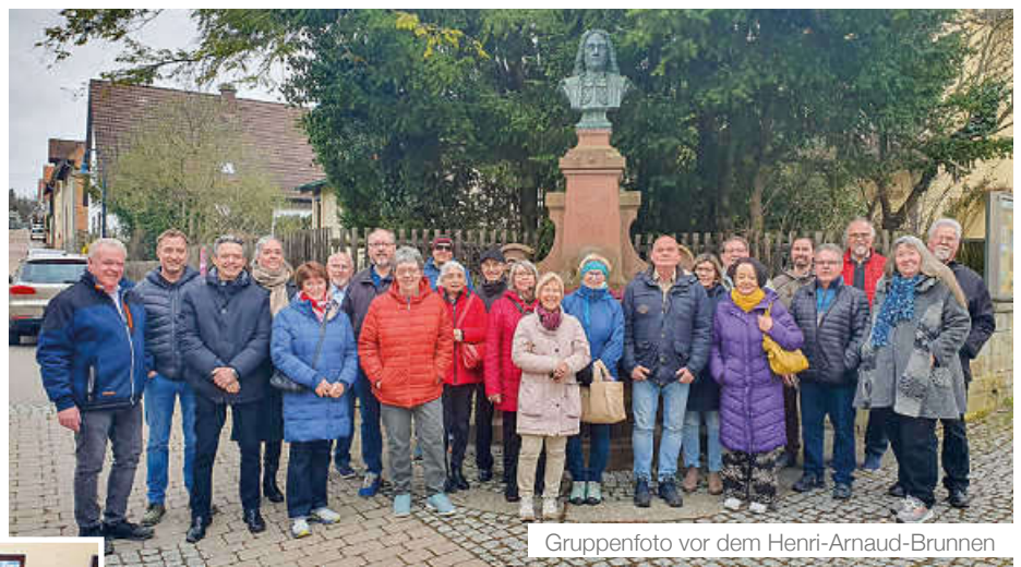
Gruppenfoto vor dem Henri-Arnaud-Brunnen

Auf Einladung des Partnerschaftskomitees der Stadt kamen 24 Vertreter der Waldensergemeinden aus Nordhausen, Wiernsheim-Pinache und Serres, Neuhengstett, Wurmberg mit Neubärental, Karlsruhe-Palmbach, Oberderdingen-Großvillars und der Deutschen Waldenservereinigung aus Schönenberg im evangelischen Gemeindehaus zusammen.